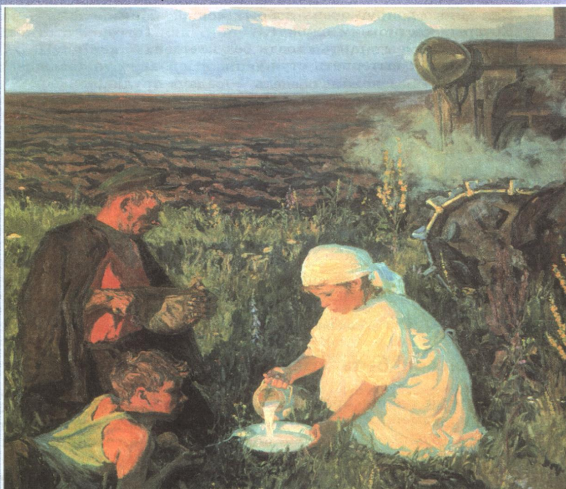
А. А. Пластов (1893—1972). Ужин тракториста. 1951 г. Художественный музей, г. Иркутск

Посмотрите на картину А.А. Пластова «Ужин тракториста». Ответьте на вопросы. Какие семейные обязанности сельских детей отражены в сюжете картины? Какой труд можно охарактеризовать как совместный, а какой - как помощь-обязанность?